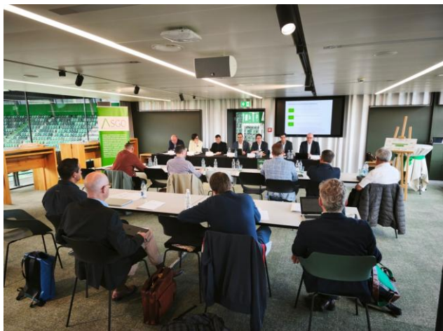
Abb. 4: Medienorientierung, 06.06.2025, im Kybun Park, St.Gallen.